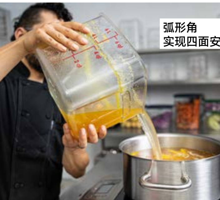
弧形角 实现四面安全倾倒